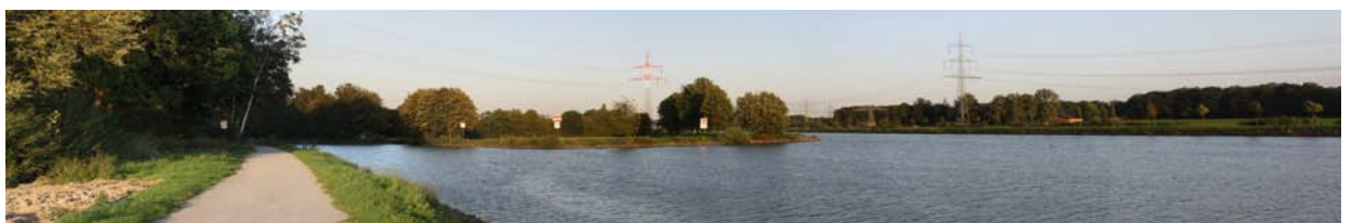
Bild (unten): Dortmund-Ems-Kanal – 350 m vom Ideenzentrum entfernt

Als Unternehmerfamilie haben wir die vorgestellten Bürogebäude vor 15 Jahren geplant und gebaut. Diese befinden sich seither in unserem Eigentum. Unser Ziel ist es, dynamische Unternehmen im Münsterland und der Umgebung zu fördern und bei ihrem Wachstum zu begleiten. Die Vermietung erfolgt deshalb ohne Maklerprovision für den Mieter und zu besonderen Konditionen.